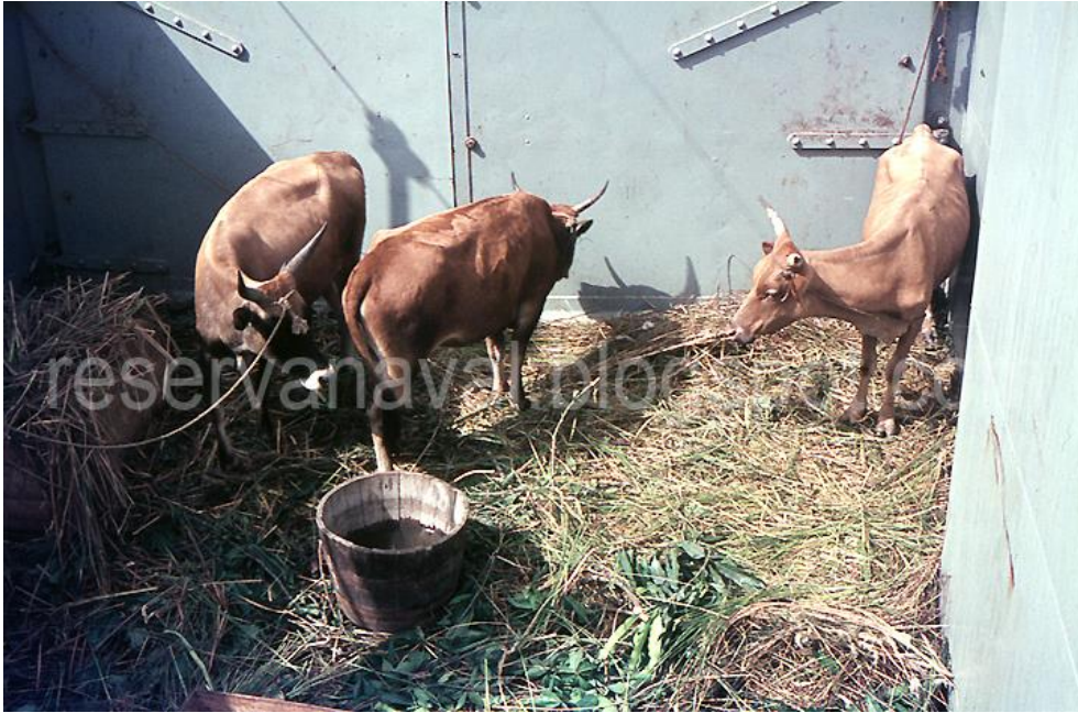
Em cima: 1971 - A LDG «Alfange» embarca logística especial e, em baixo, a mesma LDG abicada na testa da ponte-cais de Bolama