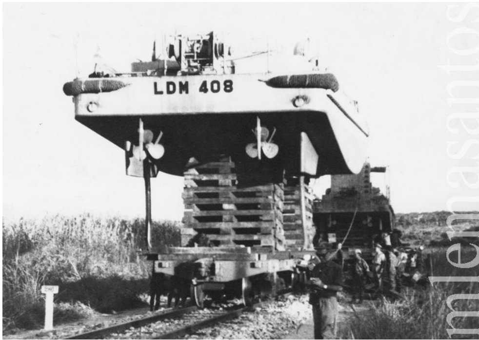
Em cima e em baixo, dois aspectos do transporte da LDM «408» para o Lago Niassa