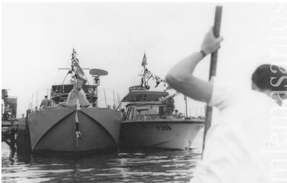
Em cima, duas LFP atracadas no Cais das Lanchas

Os sinais de insegurança e a ameaça de acções hostis no território de Moçambique noticiadas no final de 1962, levaram os responsáveis militares a reforçar a segurança com o envio da Companhia de Fuzileiros nº 2 para Lourenço Marques, onde chegou no fim de Outubro.