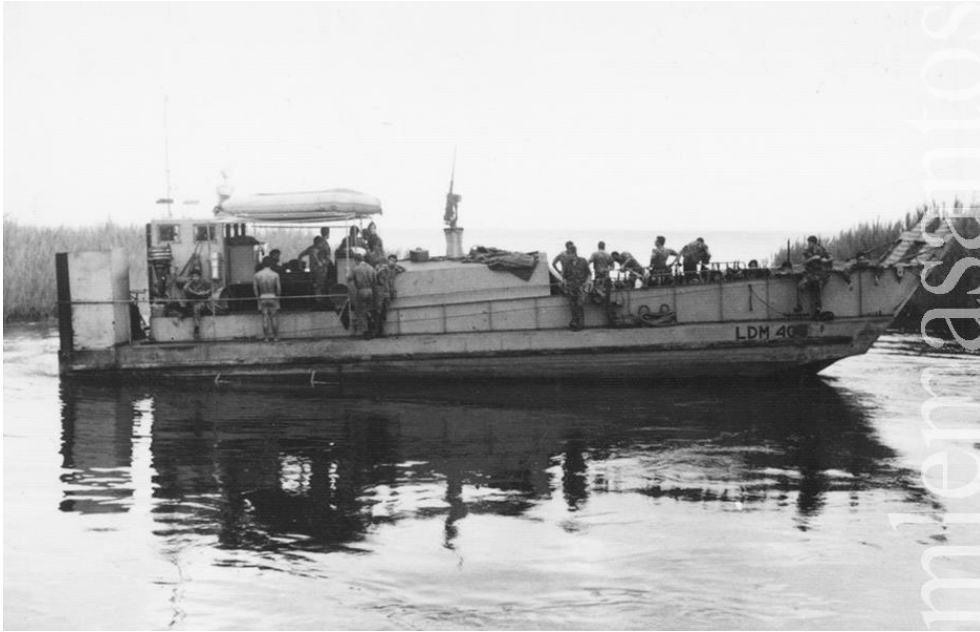
A LDM «408» em fiscalização de rotina