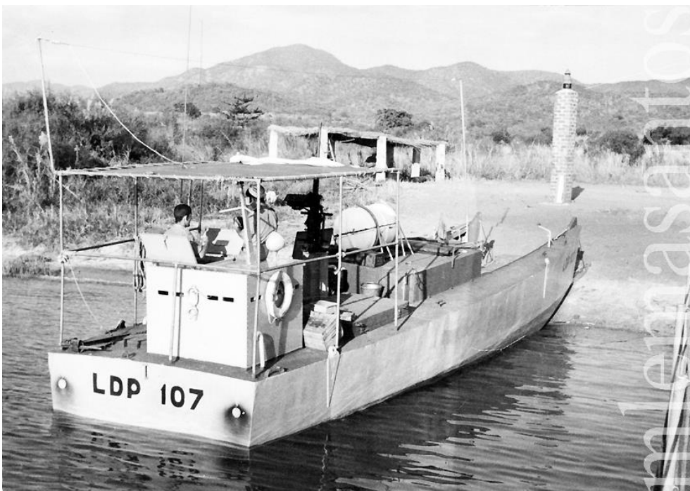
Em cima, a LDP «107» abicada e, em baixo, a LFP «Mercúrio» navega no Lago Niassa

Em Abril de 1973, quando o DFE 5 termina a comissão já não é substituído e, em Setembro de 1974, é declarado o cessar fogo que conduzirá à retracção do dispositivo, com o conseqüente regresso de todas as unidades ao Continente.