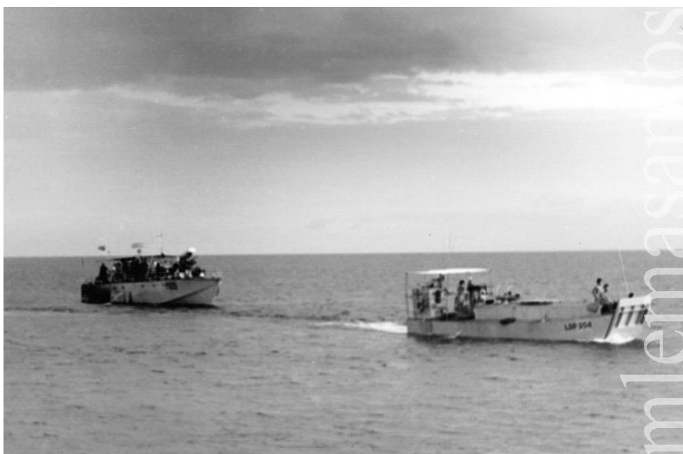
No Lago Niassa, a LDP «204» procede ao reboque de uma LFP com limitações operacionais

No início de 1965 foi transferido para o Niassa, passando a efectuar operações ao longo da faixa costeira do Lago. Ainda no decorrer do mesmo ano foi o dispositivo reforçado com mais dois destacamentos de Fuzileiros Especiais: o DFE 5 e DFE 12 e mais uma Companhia de Fuzileiros: a CF 8 , passando a dispor de duas companhias operacionais.