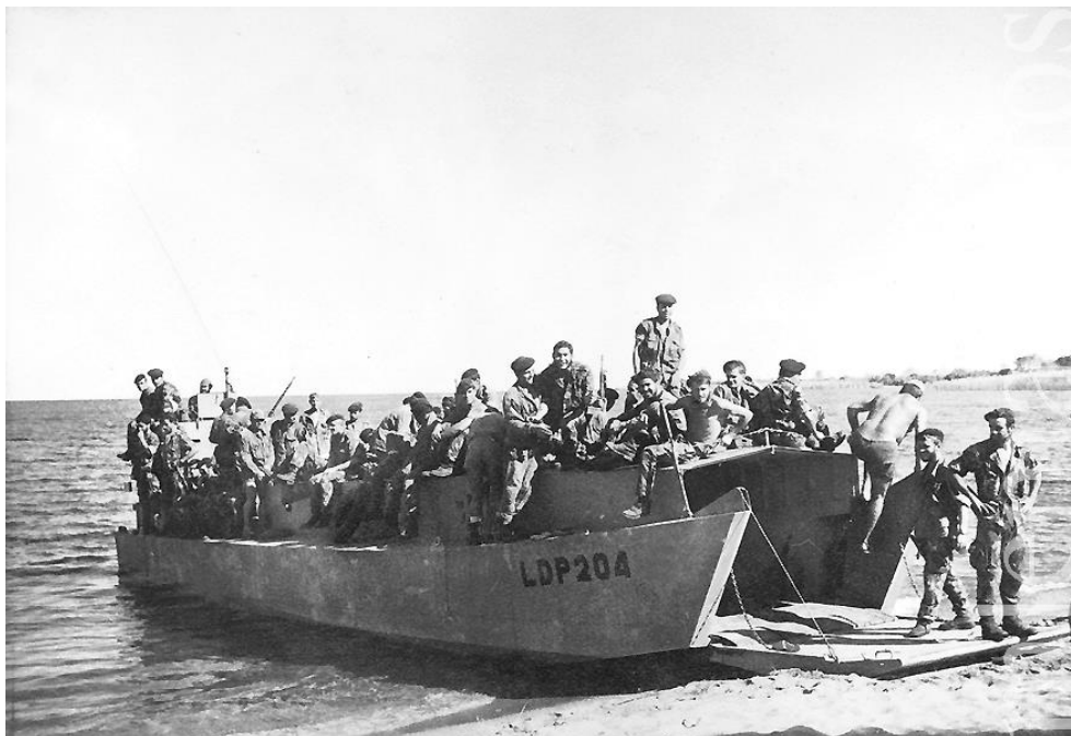
A LDP «204» abicada, num desembarque de fuzileiros

Também no Niassa - Metangula, integrando Destacamentos e Companhias de Fuzileiros, os oficiais da Reserva Naval tiveram um papel fundamental no dispositivo da Marinha de Guerra, revelando sempre um elevado espírito de missão no cumprimento das missões para que foram nomeados.