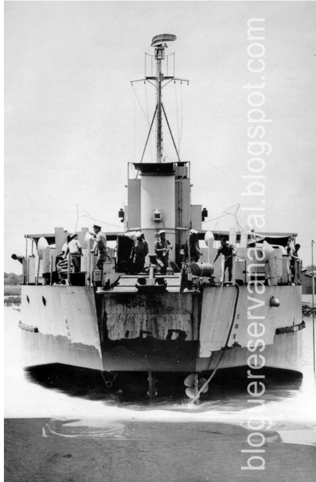
A LDG «Alfange» atingida à popa por um projectil de canhão sem recuo que não teve outras consequências além dos prejuízos materiais.

Quanto a meios humanos empenhados com guarnições de 2 oficiais, 2 sargentos e 16 praças, terão naqueles navios desempenhado missões 600 a 700 homens (LDG «Bombarda» considerada apenas enquanto em teatro de guerra).