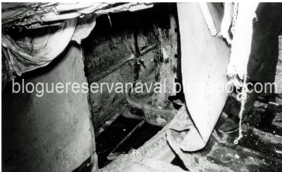
Abril, 1967 - O rombo de cerca de 1 m x 1 m provocado na LDM 309 na sequência de um rebentamento de uma mina aquática accionada de terra e montada no rio Armada, afluente do rio Cacheu

No caso particular das LDM, documentação é mesmo um mito; traduzir-se-á num “praticamente inexistente”, a não ser as referências de participação operacional que lhe são feitas nos relatórios das diferentes Esquadrilhas de Lanchas, Unidades Navais ou de Fuzileiros de que dependiam operacionalmente. Ali estariam registados parte dos movimentos quando participavam em operações ou ainda quando recebiam os “Ordmoves” descritivos de acções a efectuarem.