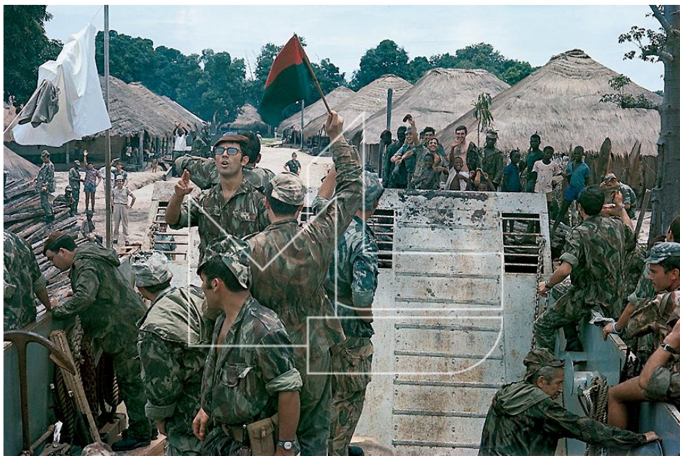
S. Domingos, Agosto 1969 - Embarque para Cacheu

Desembarque em Lisboa em 28 de Agosto de 1969;