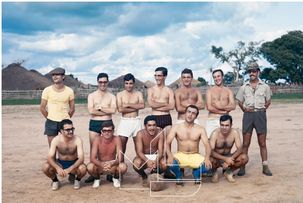
Ingoré, 1969 - Equipa de solteiros

Em 11Dez67, recolheu a Bissau, assumindo a função de subunidade de intervenção e reserva do Comando-Chefe. Nesta situação, foi atribuída em reforço do BCaç 1888 para actuação na operação "Grão Duque", realizada na região da Ponta do Inglês - Ponta Varela, de 15 a 19Dez67 e em reforço do BCav 1915, de 20Dez67 a 09Jan68, para actuação nas operações "Bolo-Rei" e "Cavalo Orgulhoso", realizadas na região de Bissum.