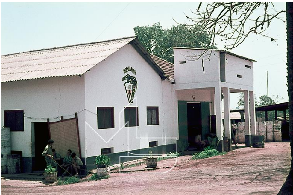
Ingoré, 1969 - Casernas

Partida: Embarque em 26Out67 e desembarque em 03Nov67;