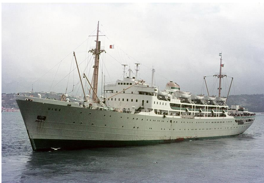
TT «Uige» a navegar

Regresso: Embarque em 20Ag069 no TT «Uige» ;