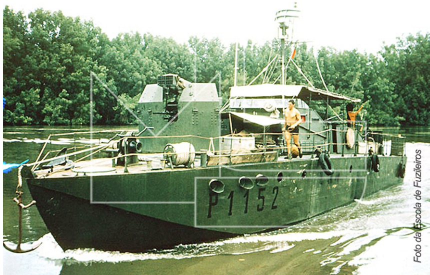
Guiné, rio Cacheu - A LFP «Aldebaran» vestida de um estranho verde

Em 2010.06.25, mls, em comunicação sobre "Imediatos da LFG «Orion» na classe «Cacine» respondeu: