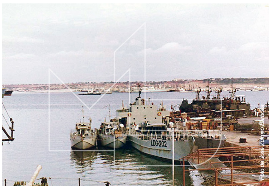
Luanda - Aspecto da base naval sendo visível a LDG «Alabarda» atracada com 2 LFP de braço dado e, do outro lado do cais, várias LFG amarradas;