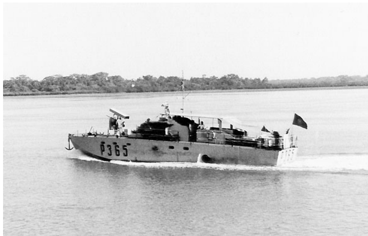
A LFP «Deneb» navegando na Guiné, não ostentando então a brancura que a alcunha sugere

Branca de Neve – Alcunha atribuída à Lancha de Fiscalização Pequena, NRP «Deneb» que, desde 1961, se encontrava na Guiné. A alcunha, claro trocadilho do nome, foi-lhe posta quando, após uma reparação, a pintura exterior, usualmente verde acastanhado escuro, surgiu bem mais clara que a das outras lanchas.