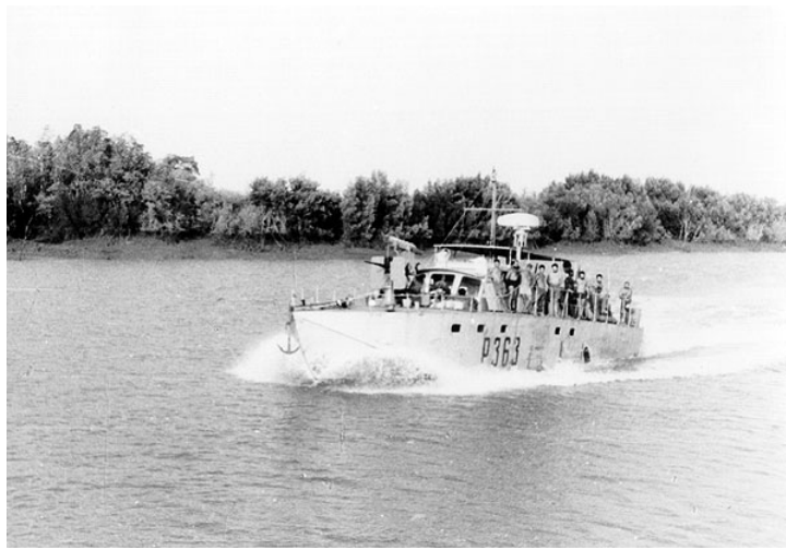
A LFP «Bellatrix» navegando no rio Cobade, na Guiné

Branca de Neve – Alcunha atribuída à Lancha de Fiscalização Pequena, NRP «Deneb» que, desde 1961, se encontrava na Guiné. A alcunha, claro trocadilho do nome, foi-lhe posta quando, após uma reparação, a pintura exterior, usualmente verde acastanhado escuro, surgiu bem mais clara que a das outras lanchas.