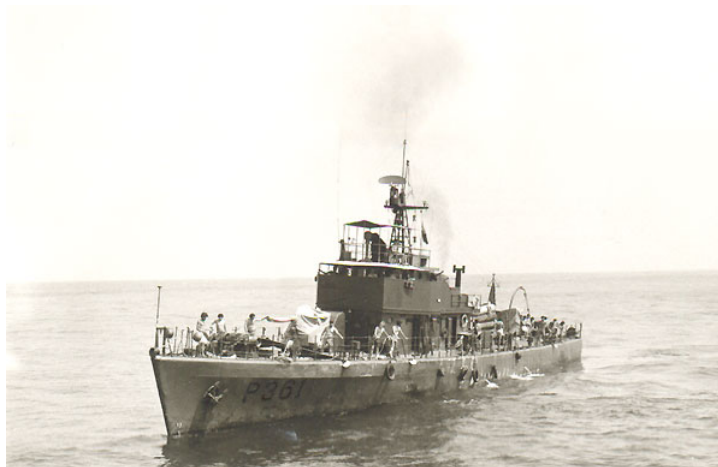
A " Velha Senhora ", navegando na Guiné.

" Velha Senhora " – Alcinha, posta na Guiné por volta de 1971, ao NRP "Lira". O navio era, então, o que se encontrava em piores condições, de propulsão, armamento e até de aspecto exterior, Apesar destas limitações o navio continuou, durante ainda um largo período de tempo, a manter a actividade operacional tal como se estivesse novo.