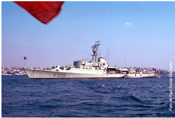
A "Gina", sem dúvida a alcunha mais conhecida de um navio.

" Velha Senhora " – Alcinha, posta na Guiné por volta de 1971, ao NRP "Lira". O navio era, então, o que se encontrava em piores condições, de propulsão, armamento e até de aspecto exterior, Apesar destas limitações o navio continuou, durante ainda um largo período de tempo, a manter a actividade operacional tal como se estivesse novo.