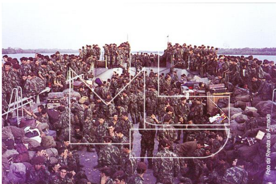
A imensa mole humana transportada numa unidade naval como a LDG «Alfange»

Foi construída nos Estaleiros Navais do Mondego e aumentada ao efectivo dos navios da Armada em 4 de Março de 1965. Em Setembro, depois de efectuar o adestramento básico e na companhia da LDG «Ariete», largou para Bissau, onde atracou a 10 de Outubro, tendo ficado atribuída ao Comando de Defesa Marítima da Guiné.