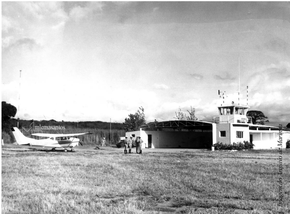
Aeródromo de Metangula vendo-se um avião «Cessna» e o hangar