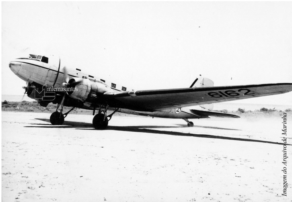
O avião «Dakota Douglas DC-47» da FAP.

Os helicópteros da Força Aérea vinham quando havia que fazer evacuações a partir do mato e, geralmente, faziam escala em Metangula para uma primeira assistência de emergência pelo médico do Comando de Defesa Marítma que era um oficial médico da Reserva Naval que integrava a Companhia de Fuzileiros que ali permanecia estacionada.