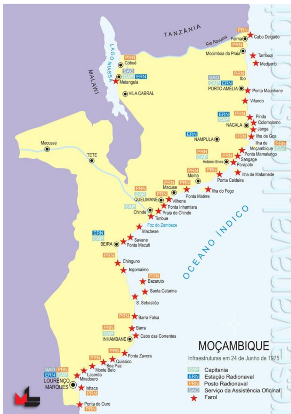
Mapa esquematizado de Moçambique mostrando Metangula, Vila Cabral e a Beira

Houve muita evacuação feita a pessoal do Exército que só foi possível por ele lá estar e por conseguir aterrar onde mais ninguém o fazia, sendo corrente que era capaz de aterrar num lenço de assoar .