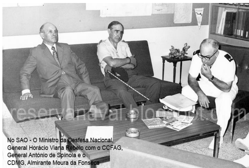
No SAO - O Ministro da Defesa Nacional, General Horácio Viana Rebelo com o CCFAG, General António de Spínola e o CDMG, Almirante Moura da Fonseca

O CCFAG – Comando-Chefe das Forças Armadas da Guiné, implementou determinadamente a formação de outro tipo de Unidades, constituídas essencialmente por militares guineenses, numa tentativa de construir uma organização militar de elite, com recrutamento local, aproveitamento do melhor conhecimento do meio, da interacção com as populações e também da forma de actuação do inimigo.