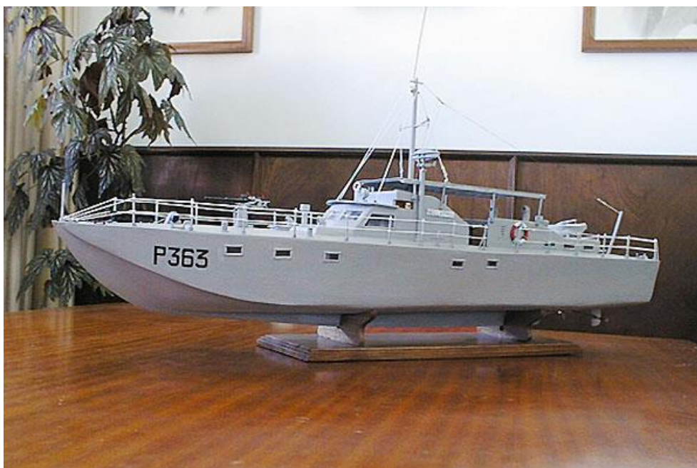
Modelo à escala da LFP «Bellatrix» existente na sede da AORN - Associação dos Oficiais da Reserva Naval