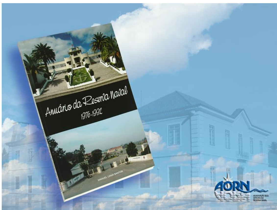
Anuário da Reserva Naval 1976-1992

A partir do ano de 1975, com o final dos conflitos além-mar, houve que encarar a retracção do dispositivo naval da Marinha com o redimensionamento consequente, redefinição do espaço geográfico e vocações próprias, bem como ainda a atribuição de prioridades operacionais específicas. Contrariamente ao previsível, mais 1.885 oficiais da Reserva Naval, igualmente distribuídos por várias classes, numa segunda geração de 78 cursos, foram formados entre 1976 e 1992.