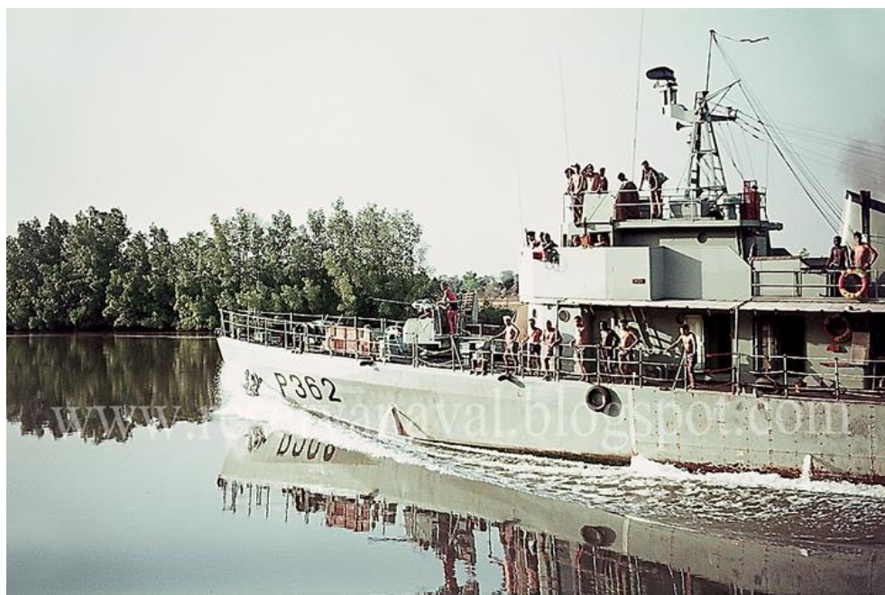
Em cima, a LFG «Orion» navega para montante no rio Cacheu e, em baixo, a LDM 307 em plena navegação algures num rio da Guiné

Podia começar assim a narrativa, alguns pormenores escapam-me pelo tempo decorrido, mas retive-a como um dos momentos que balizaram a minha comissão como oficial da Reserva Naval e Imediato da LFG «Orion», decorria o mês de Setembro de 1966, entre os dias 11 e 13 e levaram-me a colocar separadores nessa minha memória histórica.