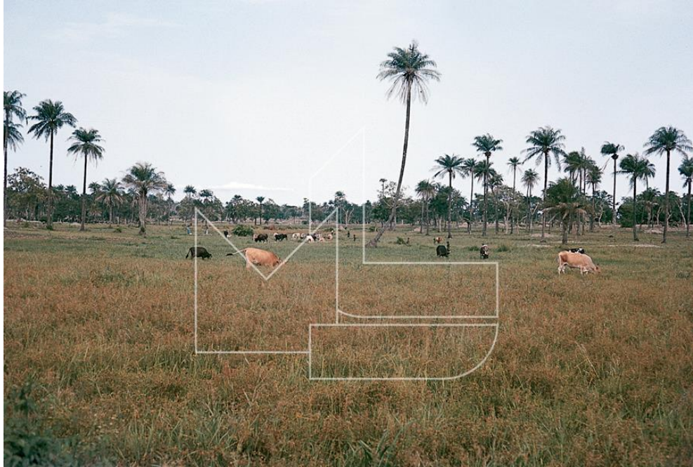
Ingoré - Pastoreio de gado bovino