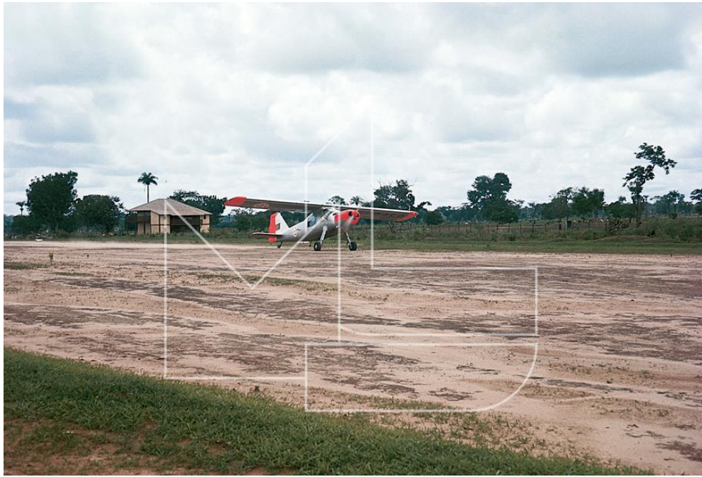
Ingoré - Pista de aterragem com um Dornier 27 na placa