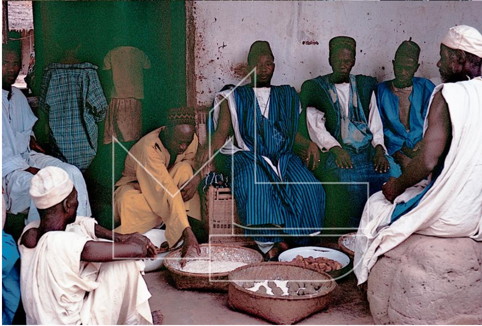
Ingoré, 1968 - No final do "Ramadão"