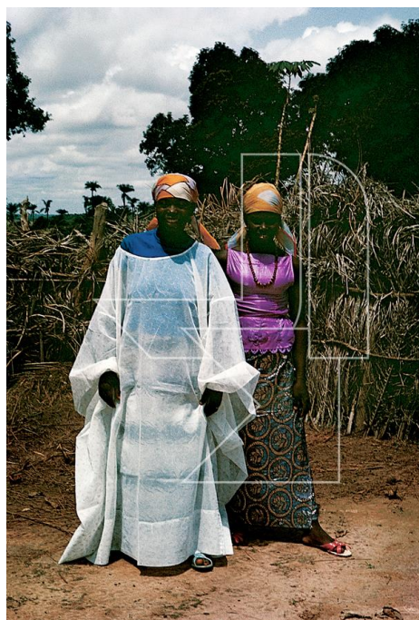
Ingore, 1968 -Trajes de festa no final do Ramadão