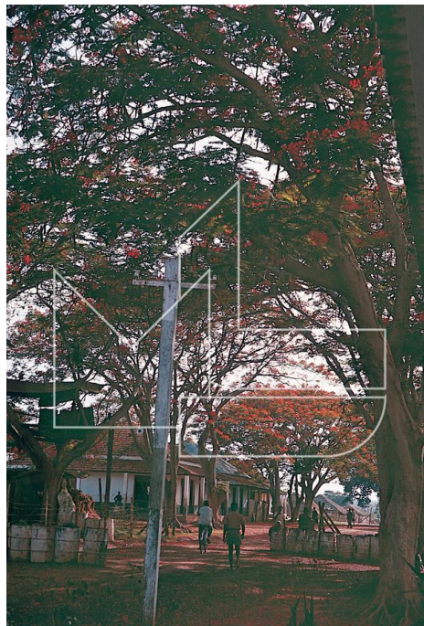
Ingoré, 1968/69 - Acácias floridas na área do aquartelamento