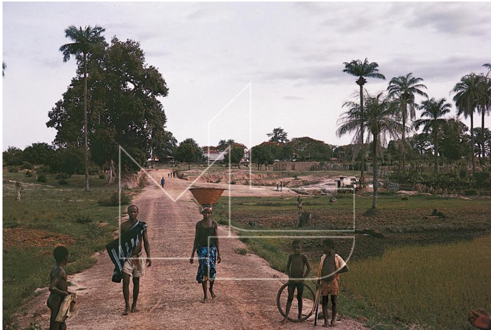
Ingoré, 1968/69 - Estrada para o Ingorezinho