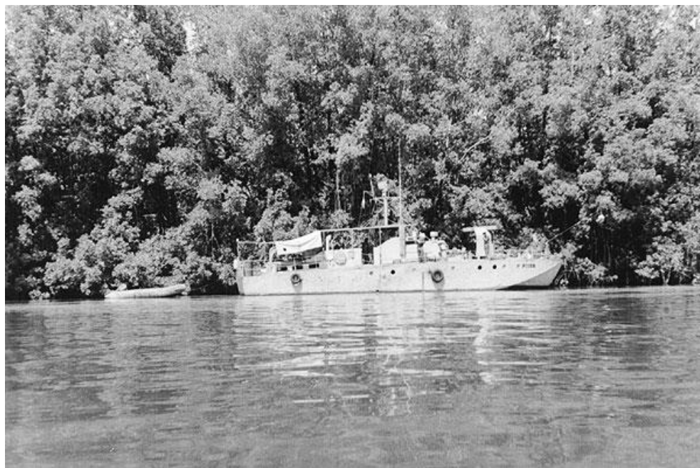
Guiné - No rio Cacheu, amarrada ao tarrafo

menos, o rebentamento de dez projecteis de "bazooka" e seis morteiradas que deflagraram próximo do navio.