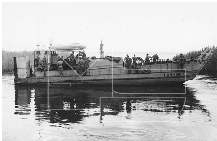
Moçambique - A LDM 408 no Lago Niassa

A confusão generalizada instala-se e, a Marinha, enquanto retrai o dispositivo no território, tem como preocupação manter a vigilância e segurança de instalações e população.