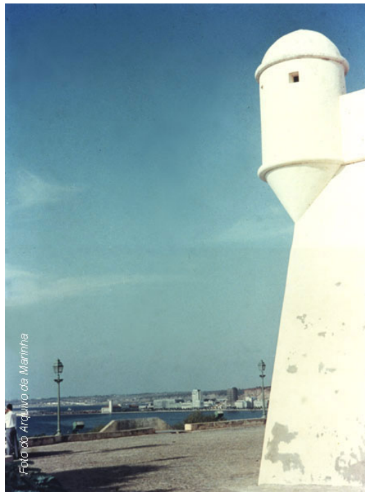
Luanda - A Fortaleza de S. Miguel

Entre Junho e Agosto, depois de uma larga sucessão de nomeações, substituições e negociações entre Forças Armadas, Comandante-Chefe e Movimentos, é nomeado um Alto-Comissário para as negociações. A Marinha começa a retrain o dispositivo no território mantendo a vigilância e guarda de instalações militares.