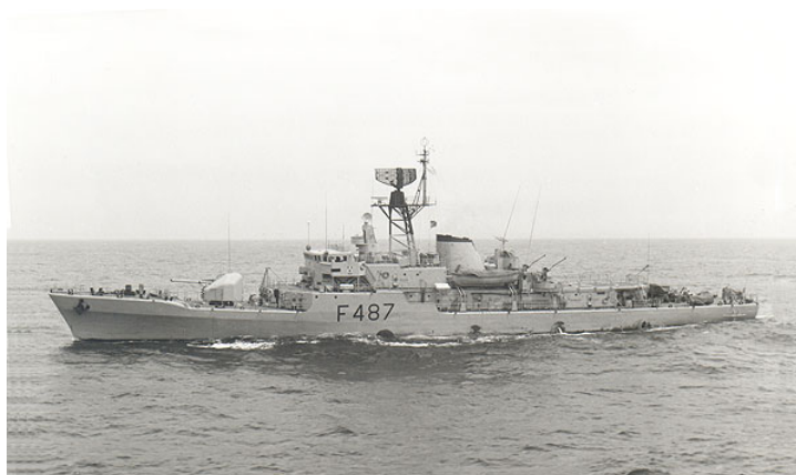
A corveta «João Roby»

Já durante o ano de 1975, foram abatidas ao efectivo de navios as LFP «Altair», LFP «Antares», LFP «Marte», LFP «Mercúrio», LFP «Pollux», LFP «Urano», LFP «Vénus», LFP «Espiga», LFP «Fomalhaut», LFP «Júpiter», LFP «Saturno» e LFP «Rigel», a LF «Dourada», as LFG «Argos», LFG «Centauro», LFG «Pégaso», LFG «Orion», LFG «Lira», LFG «Dragão», LFG «Escorpião» e LFG «Hídra», as LDG «Cimitarra», LDG «Alfange» e LDG «Ariete», os NA «Carvalho Araújo», NA «Santo André» e NA «S. Cristóvão», o NH «Almirante Lacerda» e o navio-patrulha «Maio».