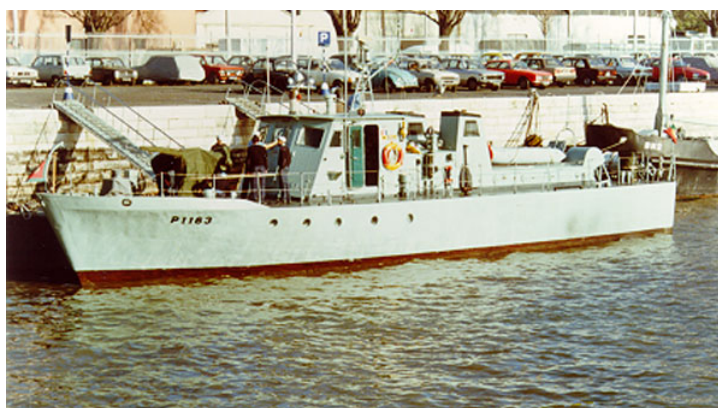
A LFP «Açor»

Foram aumentados ao efectivo as lanchas de fiscalização «Açor», «Andorinha» e «Albatroz» e, já em 1975, vieram ainda reforçar aquele efectivo a LF «Águia» e as corvetas «Oliveira e Carmo» e «João Roby».