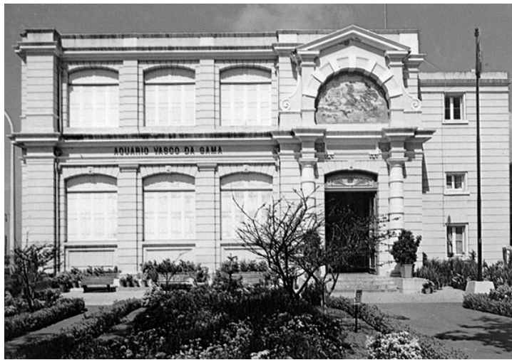
Aquário Vasco da Gama

Foram designados para prestar serviço em África, ou Continente e Ilhas, os seguintes oficiais: