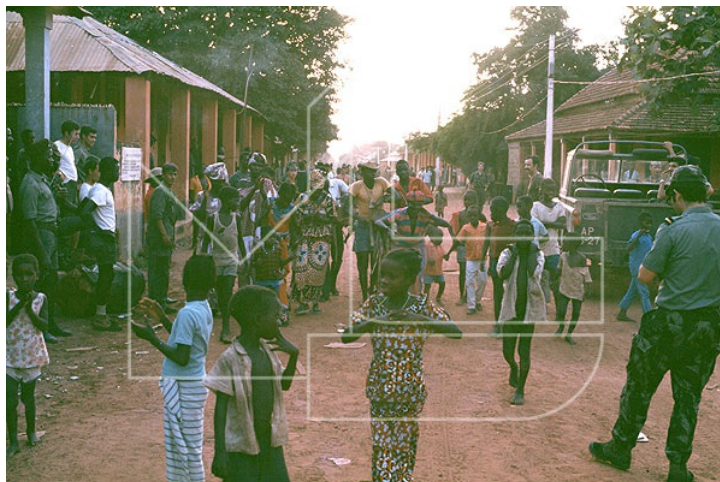
1973 - Em Bigene, próximo de Ganturê, rio Cacheu, dia de eleições locais

Em 10 de Setembro Portugal reconhece legalmente a Guiné-Bissau como Estado soberano, em 3 de Outubro de 1974 regressa a Portugal a Companhia de Fuzileiros n.º 5, a 15 de Outubro o DFE 4 e, finalmente, a 30 de Outubro, a bordo do TT «Niassa» regressa a Portugal a última Unidade de Fuzileiros na Guiné, o DFE 5.