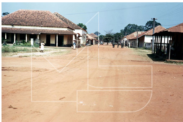
Rio Cacheu, Novembro 1972 - Próximo de Ganturé, o arruamento principal da povoação de Bigene

Em Bissau são reforçadas as forças de vigilância e segurança. Em 25 de Agosto, são desactivadas as unidades de fuzileiros que se encontravam em Bolama, os DFE' s 21, 22 e 23 que, depois de formados, apenas entregaram o armamento distribuído com instruções directas do respectivo comando, sendo de todo ineficaz a tentativa de contacto por um representante do PAIGC que ali se encontrava para o efeito.