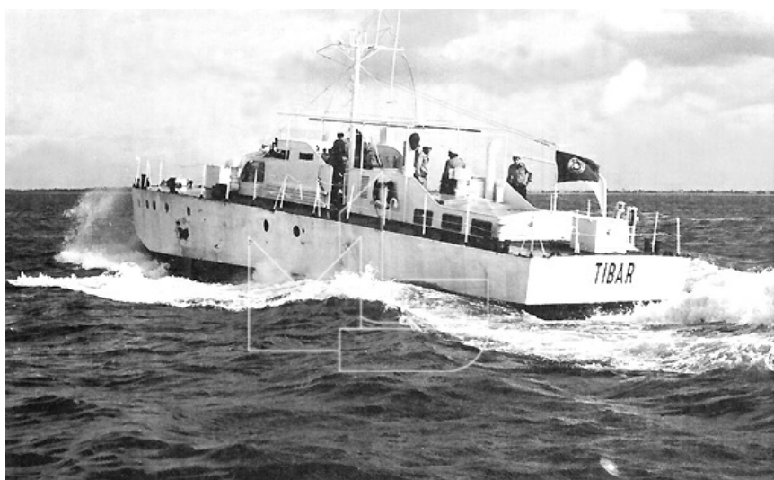
Timor - A LFP «Tibar» navega ao largo de Dili

Embarcou em 25 de Fevereiro de 1973 no navio holandês «Batjan» com destino a Timor, onde chegou a 8 de Abril, sendo atribuída àquele Comando de Defesa Marítima, provisoriamente em serviço de policiamento marítimo. Dadas as características do navio, a sua utilização esteve limitada pela não existência quer de portos de abrigo quer de pontos de apoio para reabastecimento na costa sul.