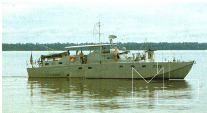
A LFP "Rigel" navegando no rio Zaire

(Post reformulado a partir de outro já publicado em 26 de Outubro de 2010)