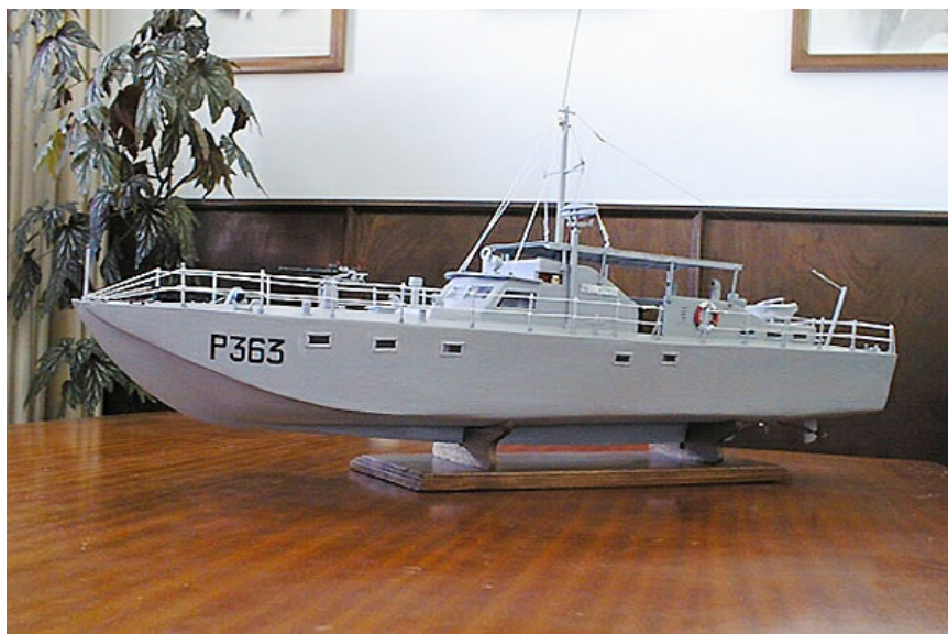
Modelo à escala da LFP «Bellatrix» existente na sede da AORN - Associação dos Oficiais da Reserva Naval