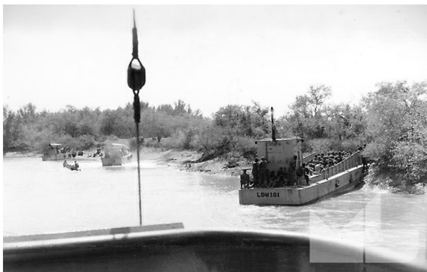
Em cima e em baixo, exemplos das LDM da classe 100 e 200

Mais do que avisos, fragatas, destroyers, navios hidrográficos, corvetas ou navios-patrolhas, com alguma representação na casa, procurei a “ poeira naval ” em que verdadeiramente se estruturou uma guerra que se arrastou por mais de uma dúzia de anos.