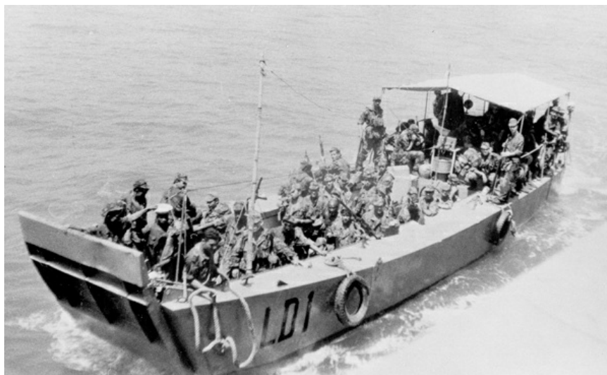
Guiné, 1963 - A LD 1, mais tarde LDP 101 e primeira da classe 100, no final de uma operação apresta-se para atracar à FF «Nuno Tristão»

em serviço para lá do ano de 1985 e algumas foram adaptadas a outras funções como instrução, formação e transporte, bem como outras tarefas.