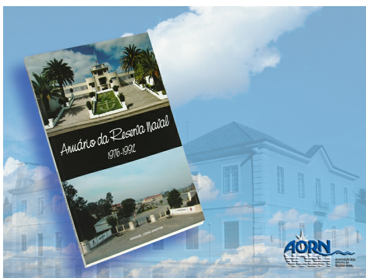
Anuário da Reserva Naval 1976-1992

A partir do ano de 1975, com o final dos conflitos além-mar, houve que encarar a retracção do dispositivo naval da Marinha com o redimensionamento consequente, redefinição do espaço geográfico e vocações próprias, bem como ainda a atribuição de prioridades operacionais específicas. Contrariamente ao previsível, mais 1.885 oficiais da Reserva Naval, igualmente distribuídos por várias classes, numa segunda geração de 78 cursos, foram formados entre 1976 e 1992.