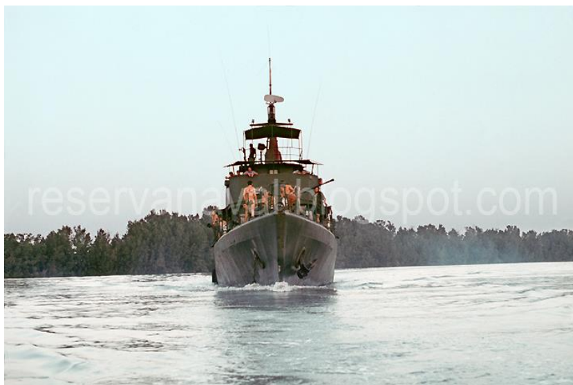
Uma LFG navega no rio Cacheu, depois de apoiar uma operação local (Dez1973)

Prevendo-se ainda a continuação da guerra, em 16 de Maio, o Estado-Maior da Armada informa que vai ser criado o DFE 23, a terceira Unidade de Fuzileiros Especiais Africanos e destinada a render o DFE 1.