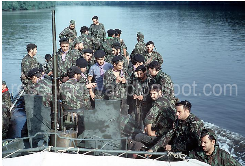
Guiné, DFE 1, no rio Cacheu, em cima (Nov1972), a navegar numa LDM, depois do reembarque de uma operação no Sambuíá

O DFE 22 em Cacine, sob o Comando Operacional do CAOP1, e o DFE 1 em Ganturé eram as únicas Unidades de Fuzileiros que, nessa data, estavam a ser utilizadas explorando razoavelmente as suas possibilidades como forças especiais (Comodoro Almeida Brandão, nota 079EM74 de 15 de Abril).