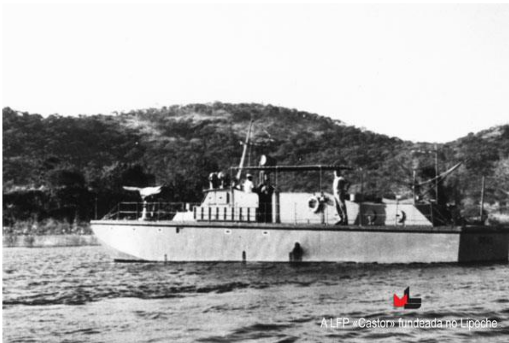
A LFP «Castor» fundeada no Lopoche

A LFP « Régulus » - P 369, da classe « Antares » foi construída nos Estaleiros da Navalís (CUF), com casco em fibra de vidro construído em Portsmouth, tendo sido aumentada ao efectivo dos navios da Armada em 27 de Janeiro de 1962, depois de desembarcada em Luanda a bordo de um navio mercante.