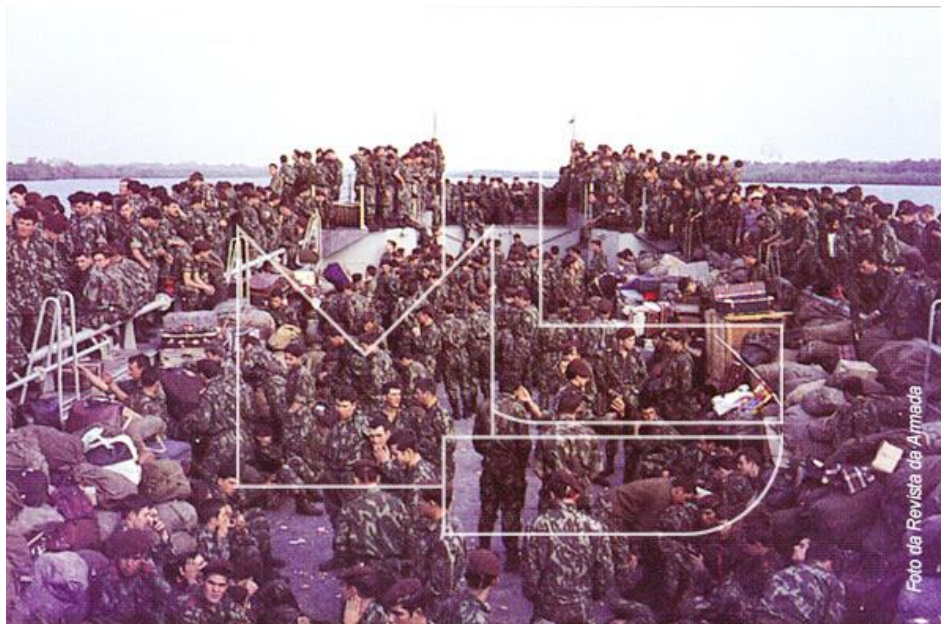
A imensa mole humana transportada numa unidade naval como a LDG «Alfange»

Foi construída nos Estaleiros Navais do Mondego e aumentada ao efectivo dos navios da Armada em 4 de Março de 1965. Em Setembro, depois de efectuar o adestramento básico e na companhia da LDG «Ariete», largou para Bissau, onde atracou a 10 de Outubro, tendo ficado atribuída ao Comando de Defesa Marítima da Guiné.