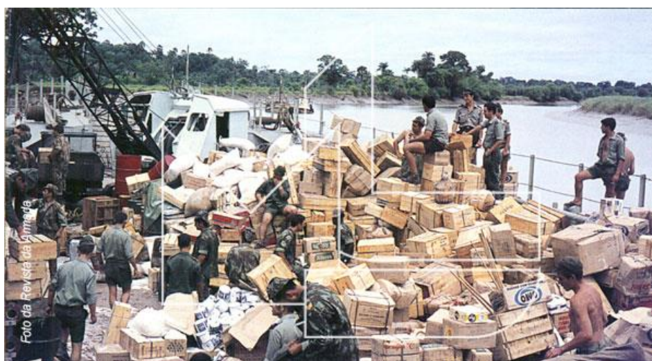
A preparar a abicagem à margem para mais uma descarga

Apesar da boa cobertura cartográfica das bacias hidrográficas guineenses, o navio depressa foi solicitado para missões logísticas, em áreas situadas fora dos limites das áreas hidrografadas, o que, em associação com as suas difíceis condições de manobrabilidade, as especiais condições de correntes e marés, e a situação de guerra que então se vivia, tornavam a sua condução num permanente acto de perícia marinheira, e a sua segurança numa constante preocupação.